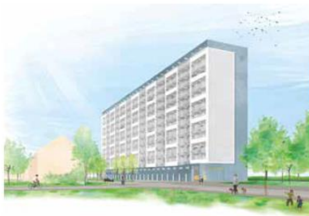
Artist Impression vernieuwing D'Blauwe Gouwe

Regelmatig houden wij u via (nieuws)brieven op de hoogte. Als u vragen heeft, kunt u contact opnemen met Joyce Meijers, zij is bewonersbegeleider bij Intermaris. Zij is per telefoon bereikbaar via 088 25 20 100 of via info@wijwheermolen.nl